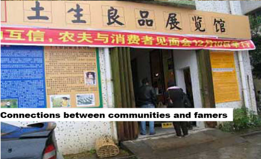
Connections between communities and famers