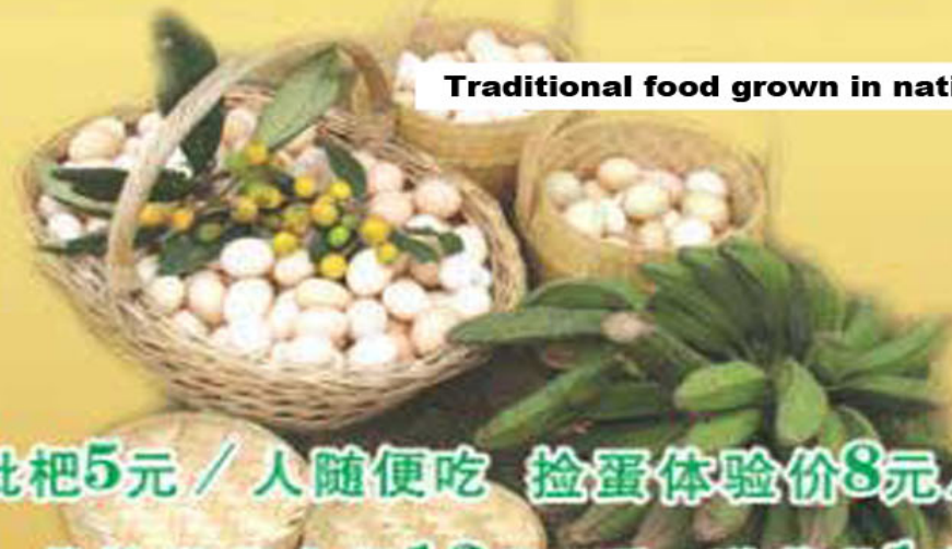
Traditional food grown in national way