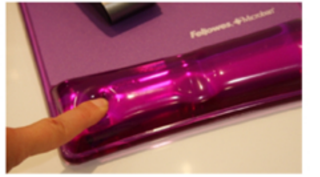
Pulseras con Usos