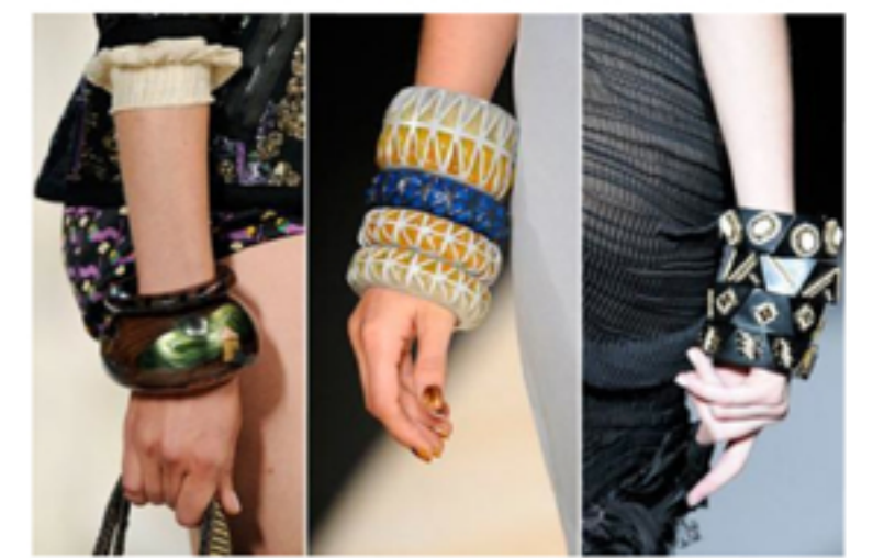
Joyas y Joyerías