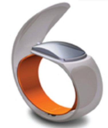
Texturas y Diseños