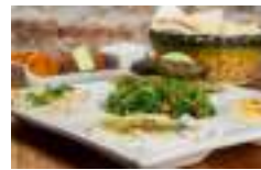
♥ La Poderosa