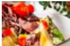
♥ El Guayoyo