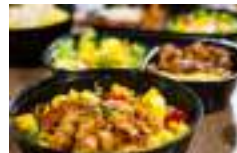
♥ La Santa Colina