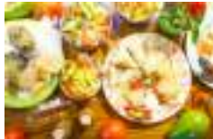
♥ Donde Julia