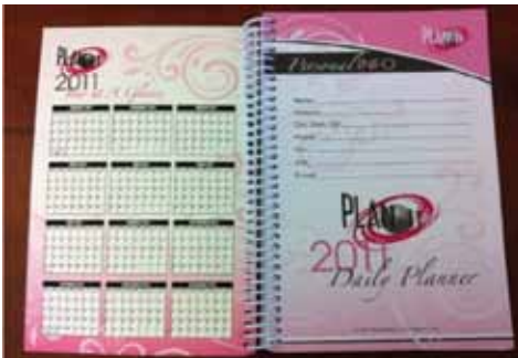
Estudiante Media Group 2011 Daily Fashion Day Planner Organizer Agenda, editorial, Plan-it.